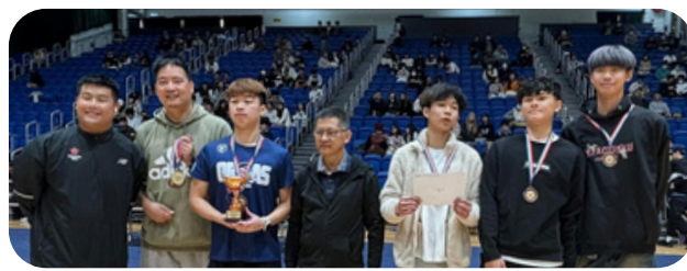
運動教練班的另一支籃球代表隊則獲季軍。