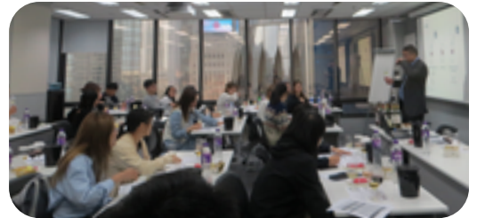
同學專心聆聽品酒老師的講解。

感謝學院提供了此次參觀波音767的機會，令應用教育文憑的學生可以參與和選修科目相關的豐富活動。有幸在飛機拆解前近距離觀看和接觸各個部件，當中更由兩位資深飛機工程師全程帶隊進行解說。透過此次親身體驗獲得了寶貴且實用的專業知識並且擴展了視野，加深了對未來投身航空業成為一名民航機師的熱忱。