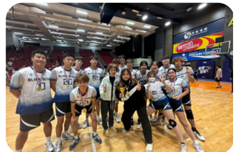
浸大持續教育學院運動教練班閃避球代表隊於「十人閃避球比賽」項目中勇奪冠軍殊榮。

香港浸會大學持續教育學院參與「應用教育文憑全方位學習活動日 - 聯校運動同樂日 2023」，與其餘七間大專院校的隊伍同場較勁，學院代表隊於閃避球項目及籃球項目膺雙料冠軍，而在籃球比賽中更同時包攬季軍，成績彪炳。