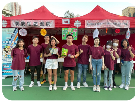
明愛慈善賣物會（維園） 2