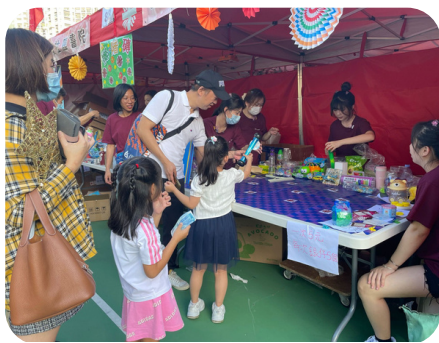
明愛慈善賣物會（維園） 1