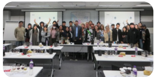
同學參加品酒會，十分興奮。