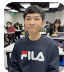
左：吳同學（物理治療學）及 右：黃同學（日語及日本文化）