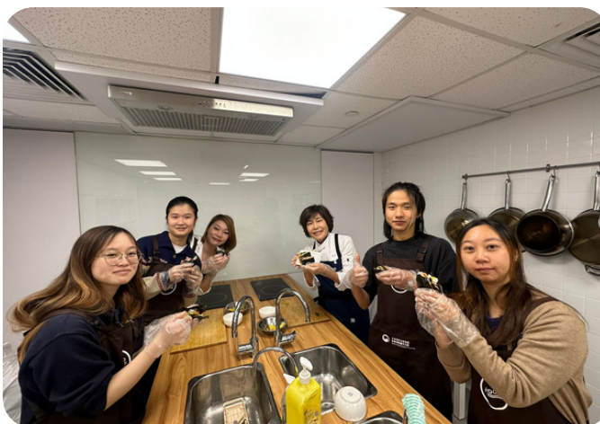
同學們親手製作泡菜壽司