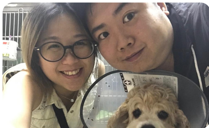
Mint、丈夫和愛犬樂也融融

Mint透露畢業後會繼續升讀HKMU LiPACE開辦的寵物護養及動物輔助治療高級文憑課程，目標是成為動物輔助治療師或狗隻訓練員。