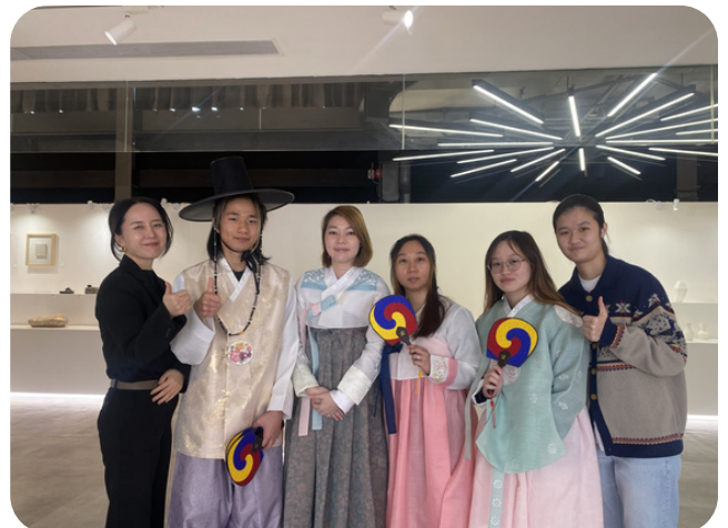
同學們穿上韓服與老師合照。