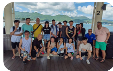
PADI開放水域潛水員牌