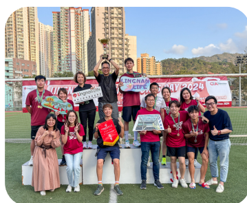
LIFE奪得嶺南大學陸運會男子團體總錦標冠軍