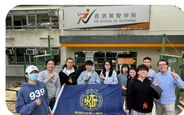
我要考車牌（香港駕駛學院學車課程）

我很開心能在科專讀書，這裏像一個大家庭，老師專業教導，職員熱心幫助。同時也感謝學校讓我能有免費學車的機會。我透過書院提供的課外活動——靜脈穿刺及抽血證書課程，加深對醫護行業的認識，增加了信心，令我獲益良多。